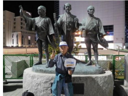
水戸駅にて (10月21日朝、夕方)